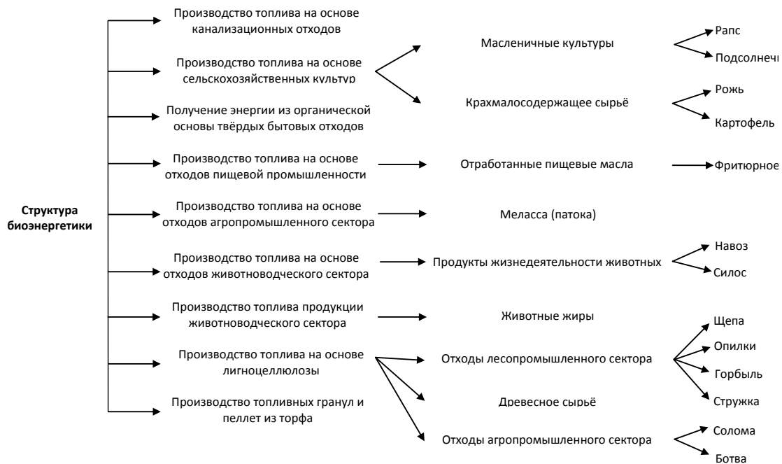
Рис. 1. Подробная схема структуры биоэнергетики Красноярского края

Более подробная схема структуры биоэнергетики представлена на рис.1, на котором указаны основные и наиболее распространённые компоненты биоэнергетики.