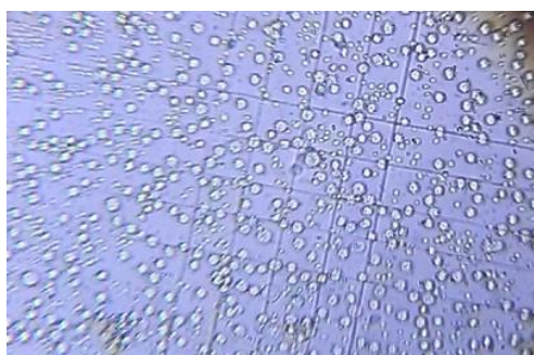
Рис. 1. Контрольная группа. Камера Горяева. Клетки асцитной карциномы Эрлиха (разведение \times 50 ). Об. 10\times , ок. 10\times

Примечание. Разница с контролем статистически значима: *при P < 0,001 ; **при P < 0,01 .