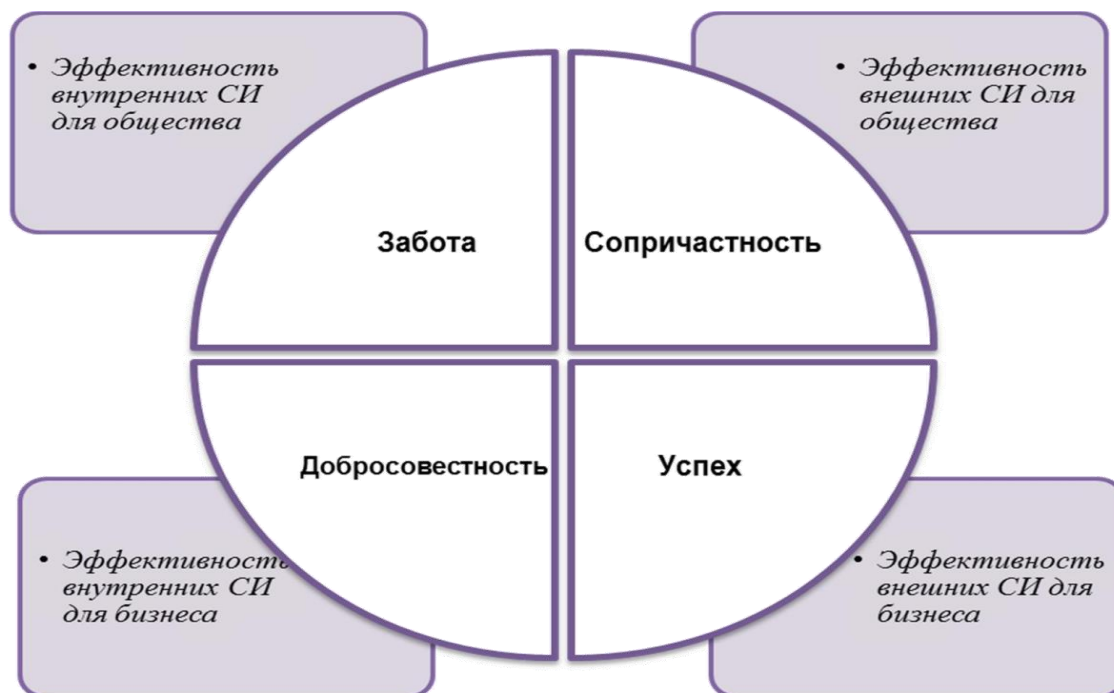
Рис. 1. Матрица оценки эффективности СИ [1]

Представленная матрица оценки эффективности социальных инвестиций показывает, что добросовестная деловая практика, забота о персонале и корпоративное гражданство вместе создают условия для успешного ведения бизнеса. Далее, на рисунке 2 представлены непосредственно сами индикаторы матрицы.