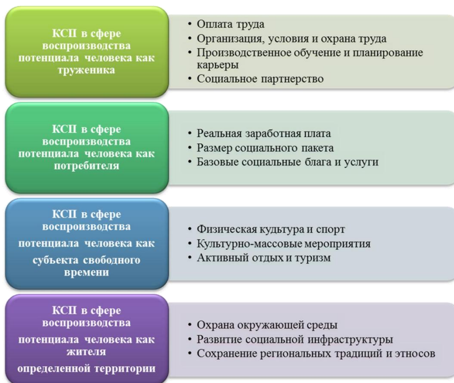
Рис. 4. Основные сферы и направления КСО (по методике Д.В. Боброва)

Так, Д.В. Бобров в своей работе выделил четыре основные сферы и тринадцать направлений КСП, которые представлены на рисунке 4.