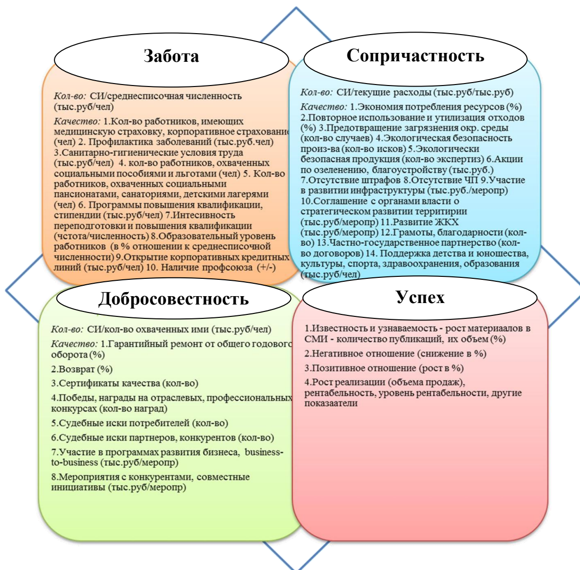
Рис. 2. Индикаторы матрицы эффективности социальных инвестиций (по методике ЭСИСП)

Затем каждой группе индикаторов присваивают базовую сумму баллов. Базовую сумму баллов распределяют внутри каждой группы по отдельно взятым показателям: каждому индикатору присваивают определенную сумму базовых баллов. Количество баллов определяют исходя из важности рассматриваемого показателя. Основное условие – сумма базовых баллов в каждой номинации должна быть одинаковой, не зависимо от количества выбранных показателей в каждой номинации. Непосредственно само распределение баллов осуществляет экспертный совет, учитывая ситуацию в регионе, целенаправленность социальных инвестиций. Кроме того, экспертный совет определяет дополнительные баллы за особо актуальные направления и формы социальных инвестиций.