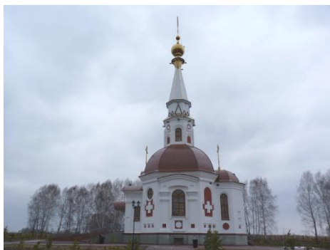
Рис. 3. Часовня Анастасии Узорешительницы (трасса М51, Кемеровская обл., 2009, арх. Виктор Усольцев).

стены декор в виде крестов, кругов, квадратов. Часовня является частью мемориала, посвященного жертвам Сиблага (рис. 3).