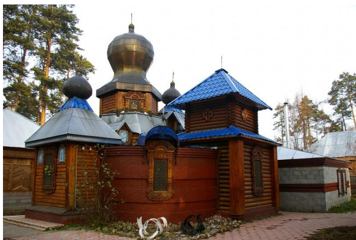
Рис. 2. Благовещенская церковь (с. Тимирязевское, Томская обл., 1999).

Второй аспект нынешнего бытования сибирского барокко касается возведения храмов-новоделов. В деревянном зодчестве есть примеры воплощения элементов стиля сибирского барокко. Например, в Благовещенской церкви (с. Тимирязевское, Томская обл., 1999) при мощных, приземистых пропорциях наличники выполнены в виде картушей и волют, характерная деталь – грушевидная глава, результат влияния украинской архитектурной традиции. Проектировщики, вероятно, хотели воплотить каменные формы в дереве, что относится к архитектурной традиции XIX века (рис. 2).