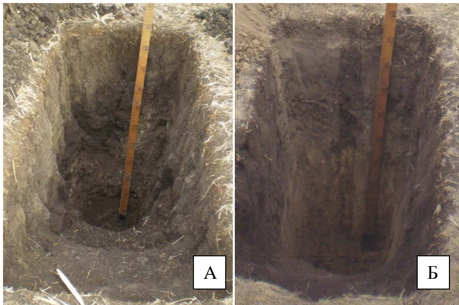
Рис. 1. Разрезы: А – Р2-2010, участок с 30-суточным затоплением; Б – Р4-2010, не- или кратковременно затопляемый участок. Азимут фотосъемки 10 и 15°